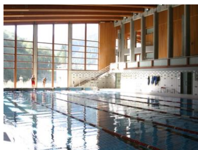
Palazzetto comunale Sport Haus