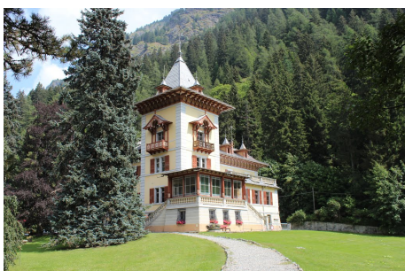
Villa margherita – Municipio

Il patrimonio immobiliare è costituito dai seguenti edifici: