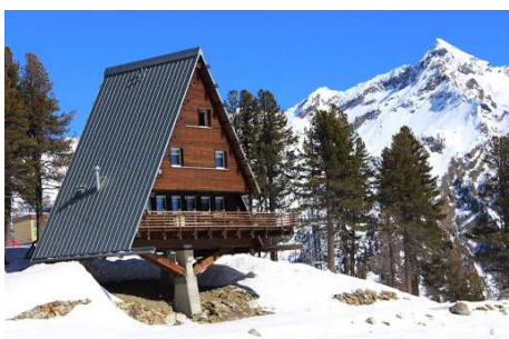
Casa Capriata – Rifugio Mollino