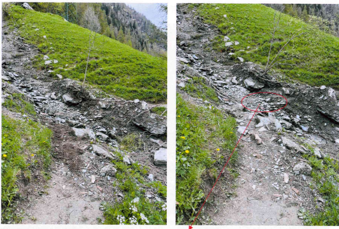
Tratto tubazione acquedotto comunale esposto a seguito di evento alluvionale di aprile 2025